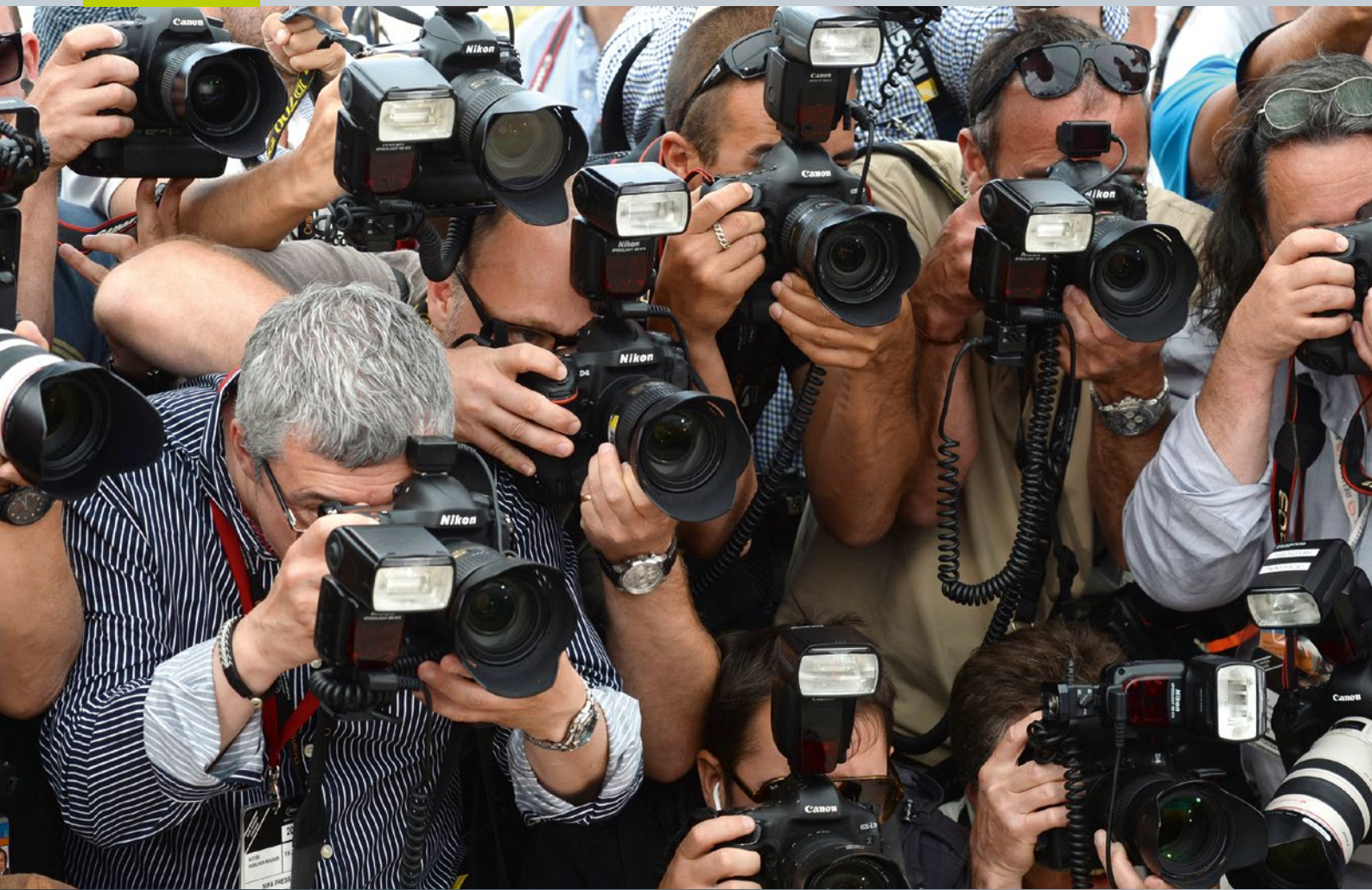
Pressefotografen während eines Photocalls bei den Filmfestspielen in Cannes, 2014